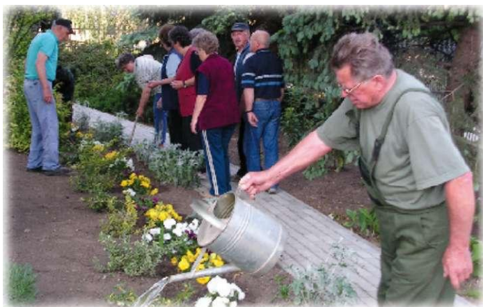
Kezdjük a munkát!