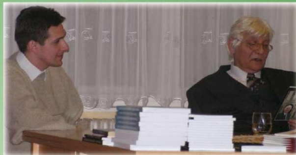
Az író önmagát olvassa...