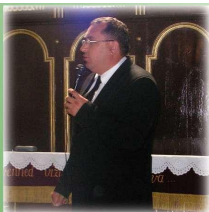
Az Úr velünk volt Myanmarban is...

Ezért Isten segítségét kérve újra odaszentelem magamat annak, hogy én is legyek olyan, amilyennek egyházamat szeretném látni.