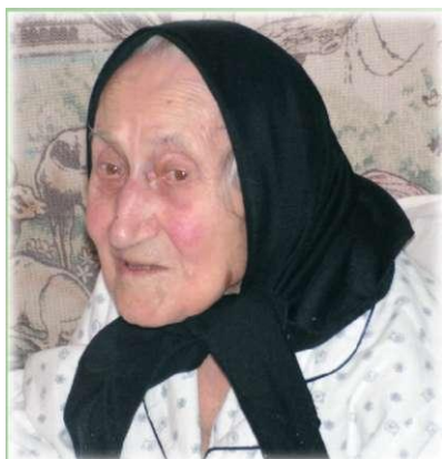
101 éves lettem