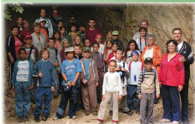
Vártuk az ősembert...!