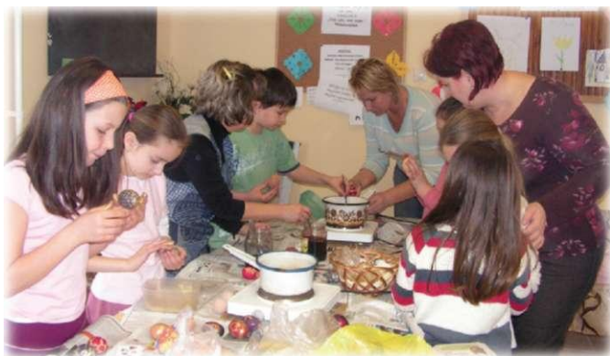
Készülnek a húsvéti tojasok...