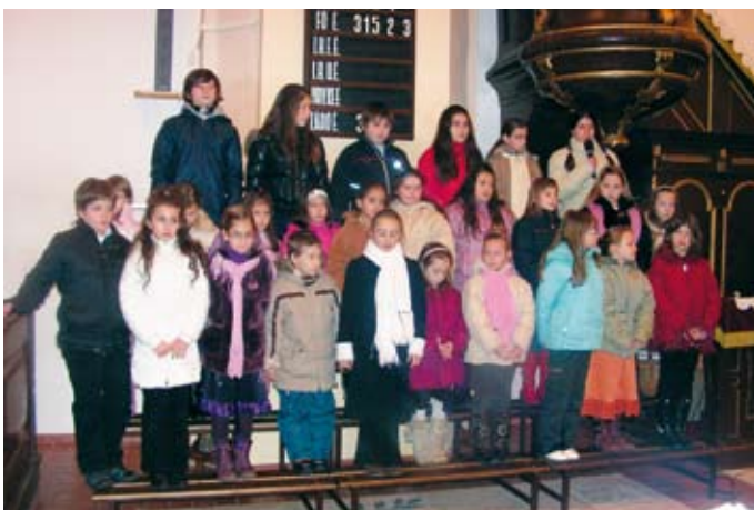
Iskolás hittanosaink karácsonyi műsora