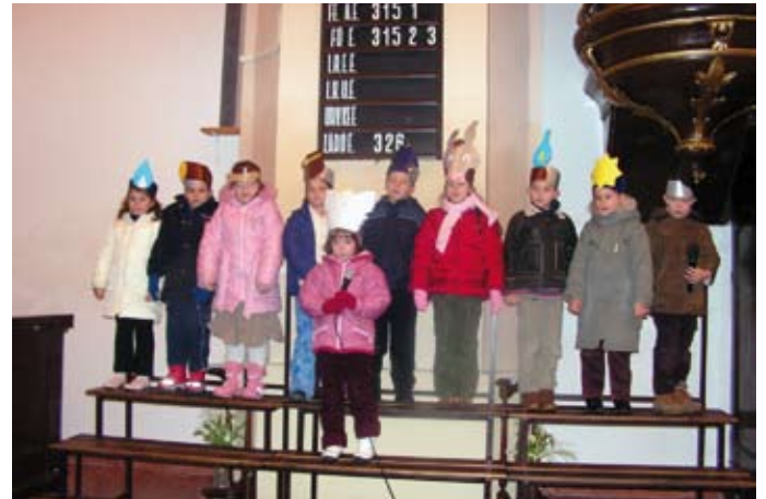
Az óvodás hittanosok karácsonyi műsora