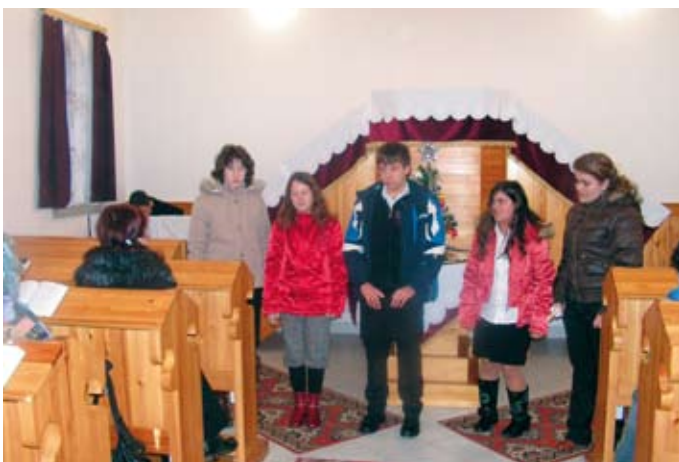
Karácsonyi műsor Szorgalmatosan