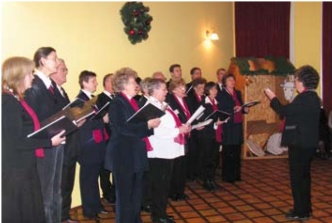
Énekkarunk szolgálata karácsonykor a Szociális Otthonban